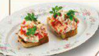
БРУСКЕТТА С КРАБОМ И СЫРОМ СТРАЧАТЕЛЛА