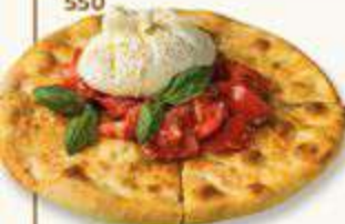
РУЛЕТКИ ИЗ БАКЛАЖАНОВ С СЫРОМ РИКОТТА