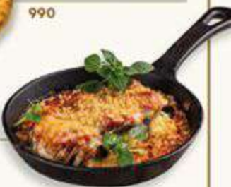
НЬОККИ ИЗ РИКОТТЫ С БЕЛЫМИ ГРИБАМИ И СЫРОМ СТРАЧАТЕЛЛА